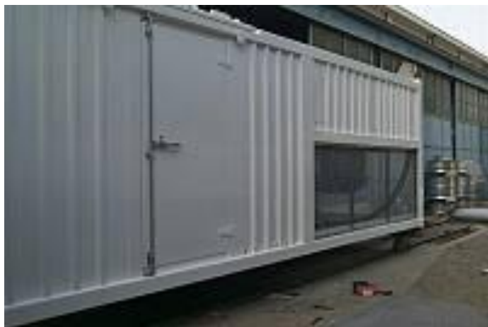
διαστάσεων (2,5x2,2x7,6) (Υ x Π x Μ)